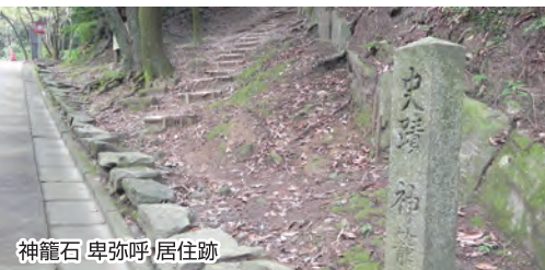
神籠石 卑弥呼 居住跡

今回は、筑後みやま市の卑弥呼の里、瀬高町の歴史の旅に行ってきました。二〇年前に瀬高町をぶらりと歩いて感じた事は、「何か古代の雰囲気漂った町だなあ」と思いました。土を掘りおこしたら、古代の宝物がザクザクと出てくるのではないかと思います。後で、地元の人に聞くと、実際そうらしいですよ。